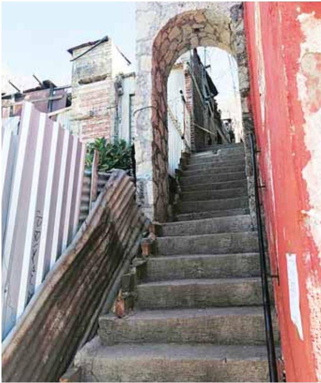
► En este inmueble fue localizado el anciano muerto.

policiaca@imparcialenlinea.com / Teléfono 501 83 00 Ext. 3176