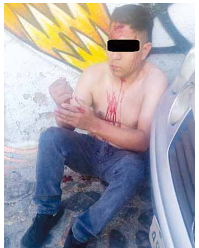
► El presunto ratero dijo que robaba por necesidad.

La fémina continuó diciendo que el tipo le pidió que se desnudara, al mismo tiempo que intentó cerrar las puertas del local, cuando otra joven que atiende un local de accesorios, que se ubica sobre la misma calle, se dio cuenta de lo que pasaba, pidió ayuda y fue que el sujeto salió corriendo y lograron atraparlo.