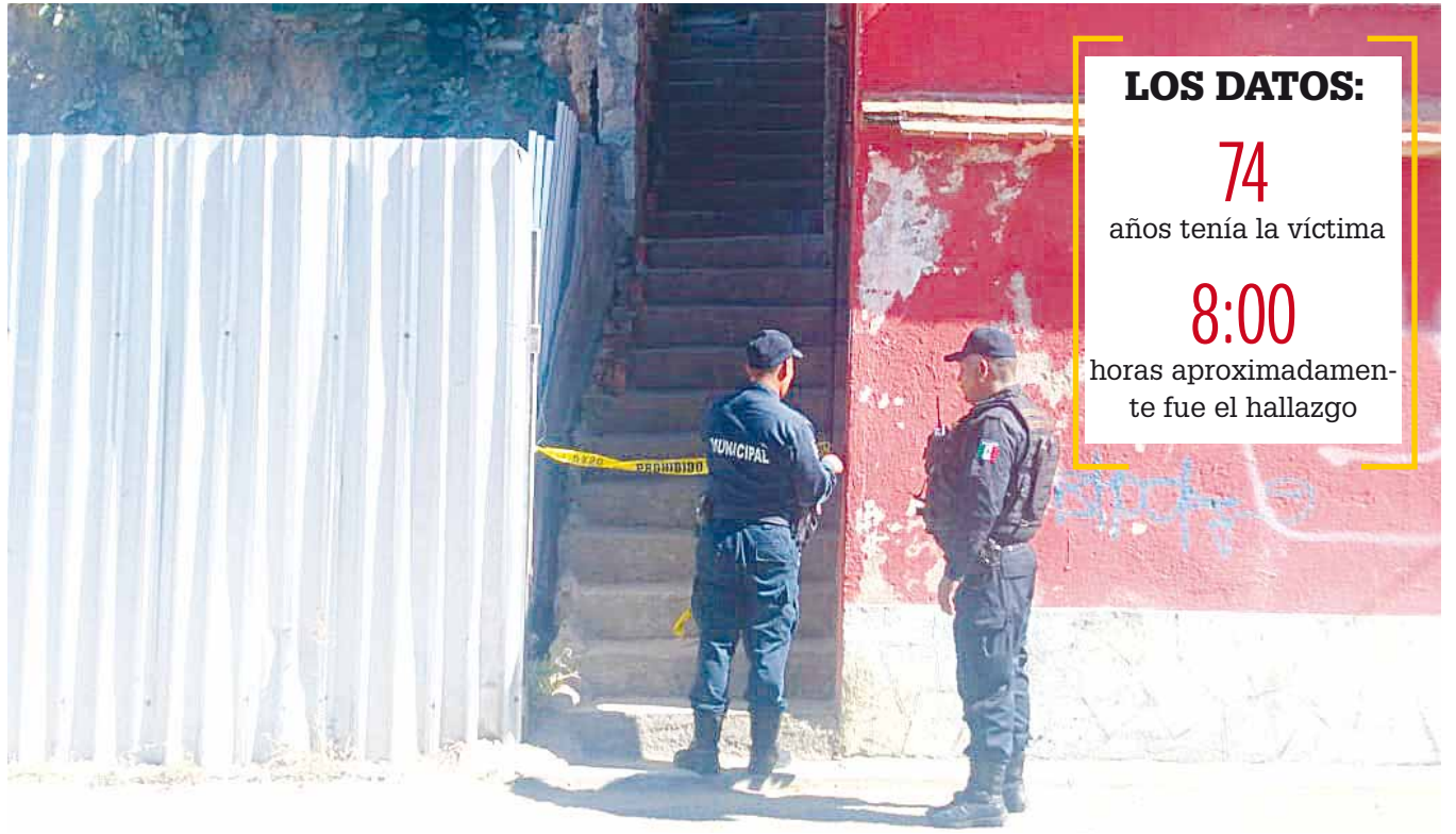
► El lugar fue resguardado por elementos de seguridad pública.