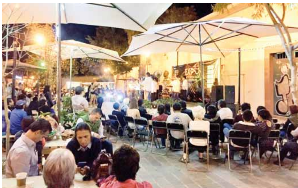
► El Jardín Carbajal será la única sede de Noches de Arte.

Se estima que hasta la edición nueve, el programa había logrado reunir a más de un centenar de asistentes en una sola edición e incluso superado los miles en otras, por ejemplo, en las que han contemplado conciertos.