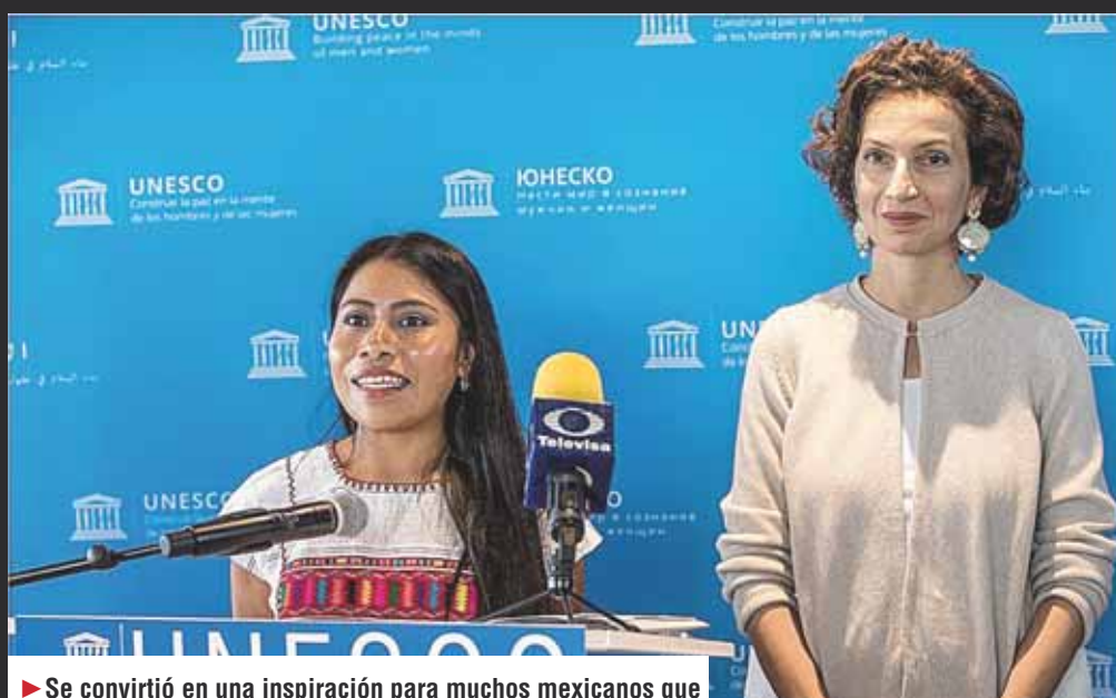
► Se convirtió en una inspiración para muchos mexicanos que son discriminados por sus rasgos y origen indígenas.