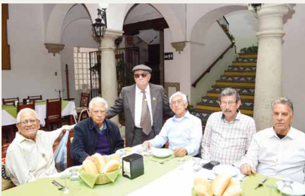
► Amigos del festejado compartieron el momento.