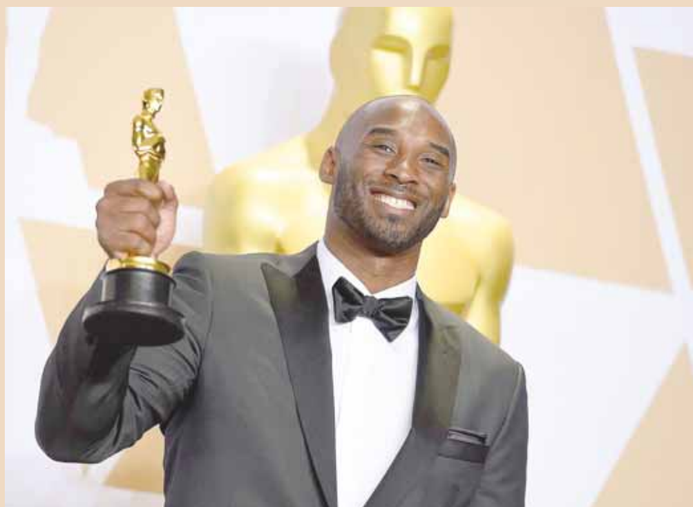
► Bryant falleció a los 41 años.

La obra, que consiguió el premio Oscar pero también el prestigioso premio Annie, no supuso la única inclusión de Bryant en el audiovisual. El deportista fundó la productora Granity Studios con el objetivo de desarrollar contenido original que uniría deporte con elementos de fantasía, y también participó en proyectos como Kobe Bryant's Muse, un documental de Showtime que detalla los altibajos de su carrera.