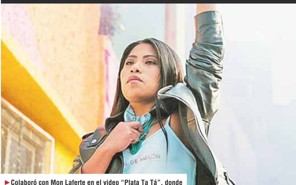
► Colaboró con Mon Laferte en el video "Plata Ta Tá", donde utilizó el símbolo de la lucha por el derecho al aborto.

enesena@imparcialenlinea.com / Teléfono 501 83 00 Ext. 3172