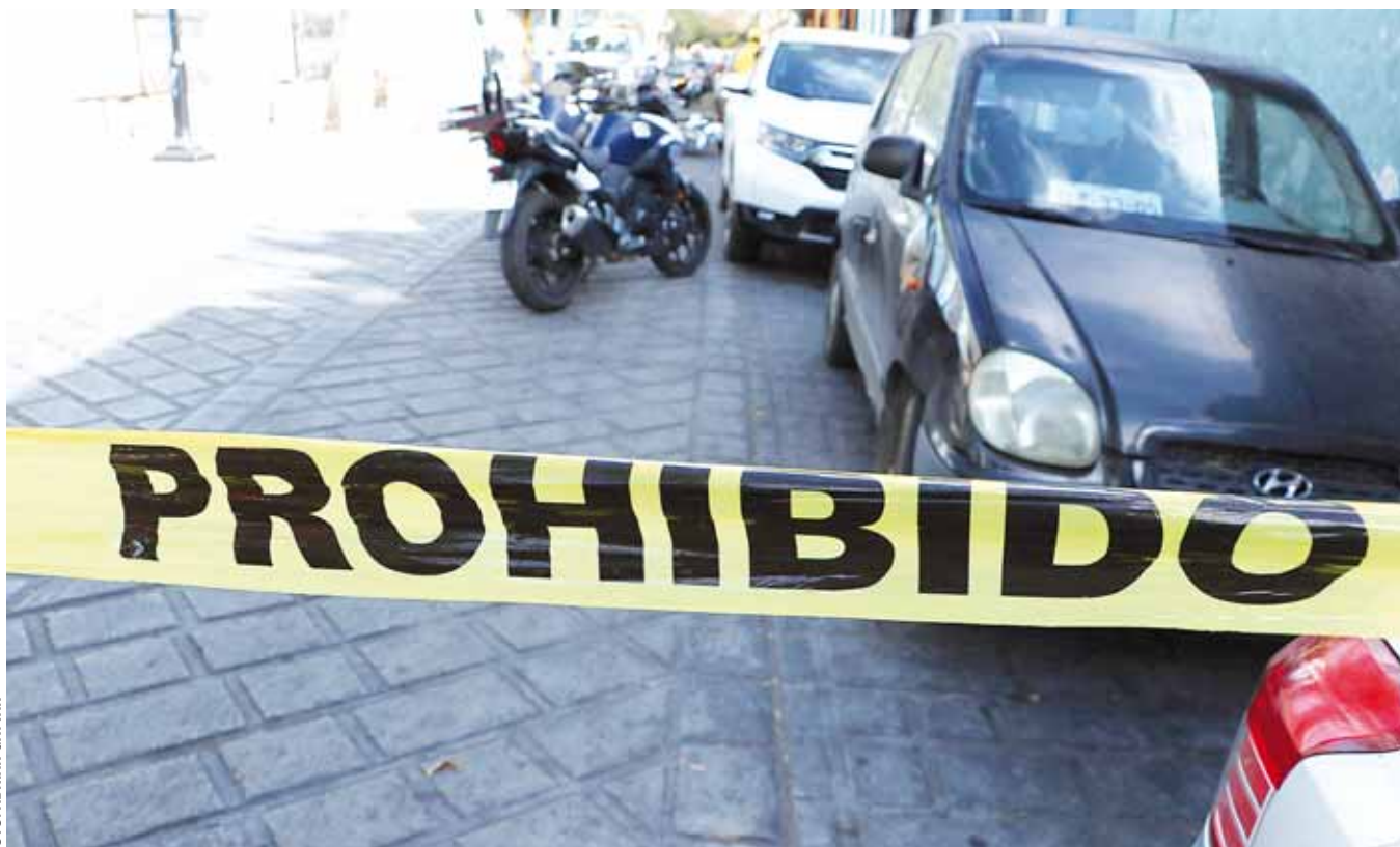
► En las últimas semanas, los delitos en la ciudad han aumentado; exigen mayor seguridad.

Consideró que en medio del aumento de la violencia, los elementos municipales tampoco están capacitados para enfrentar el crimen organizado, “porque para eso necesitan tener una academia y capacitarlos de manera frecuente de uno a dos años en temas de derechos humanos, cuestiones legales y tácticas”, apuntó.