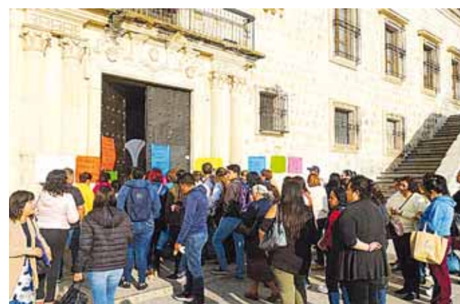
► Llegaron a un acuerdo, por lo que hoy a primera hora retomaron labores.

“Ya se comprometieron a entregar todo el material de trabajo, que haya respeto entre el personal de confianza y los de base, que ya no van a mover a ningún compañero de base, en las áreas donde les quitaron sillas y escritorios a los compañeros se les va devolver, principalmente