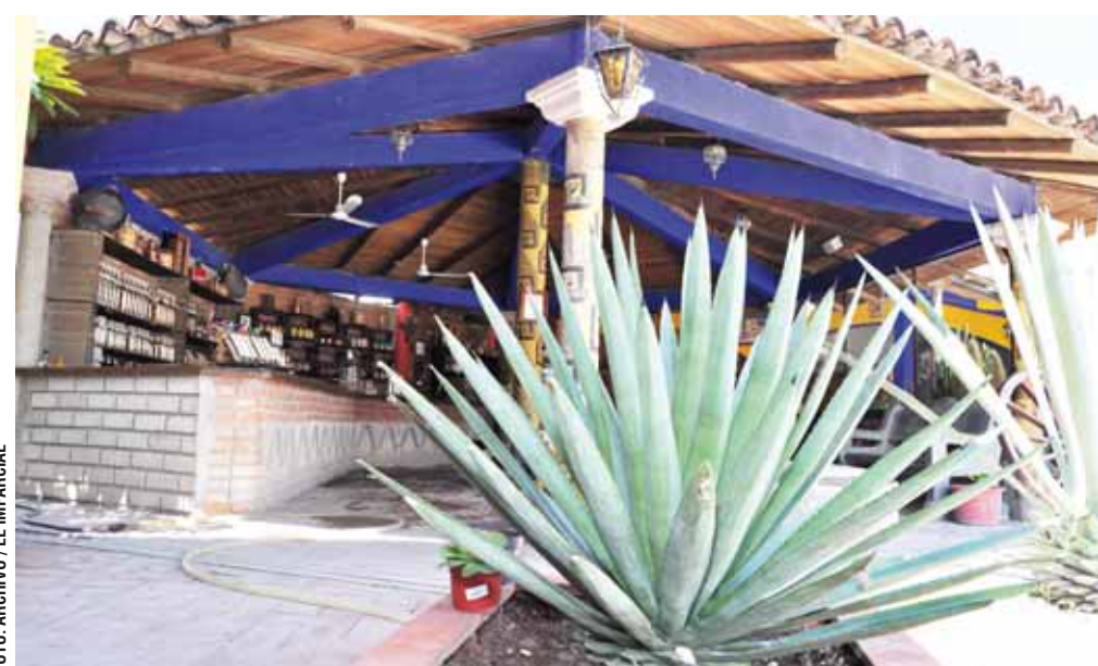
Ante la alta demanda de la bebida espirituosa, la autenticidad está en grave riesgo, alerta el Centro de Estudios sobre el Maguey y Mezcal.