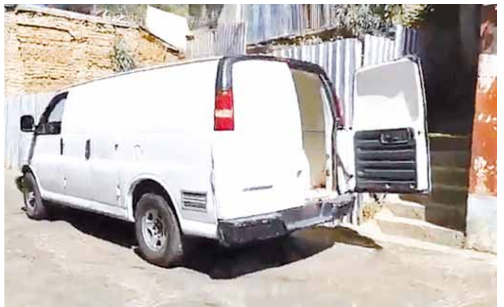
► Peritos de la Fiscalía realizaron las diligencias en el caso.

que no habían visto a su progenitor, después de varios minutos de insistencia, el hombre decidió introducirse al domicilio y se brincó la barda.