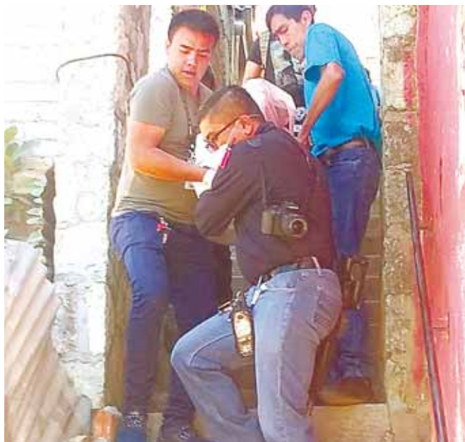
► El cadáver fue trasladado al anfiteatro.

La víctima estaba maniatada de pies y manos, amordazada y con varias lesiones en diferentes partes del cuerpo; se presume un asalto