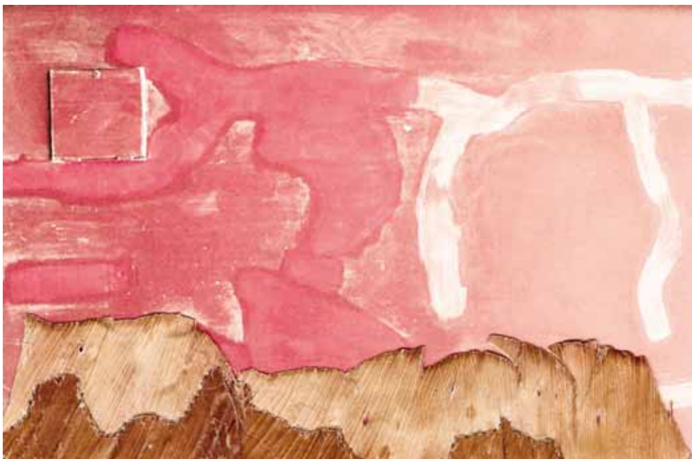
► Cordilleras, impresas en papel de algodón.

enesena@imparcialenlinea.com / Teléfono 501 83 00 Ext. 3172